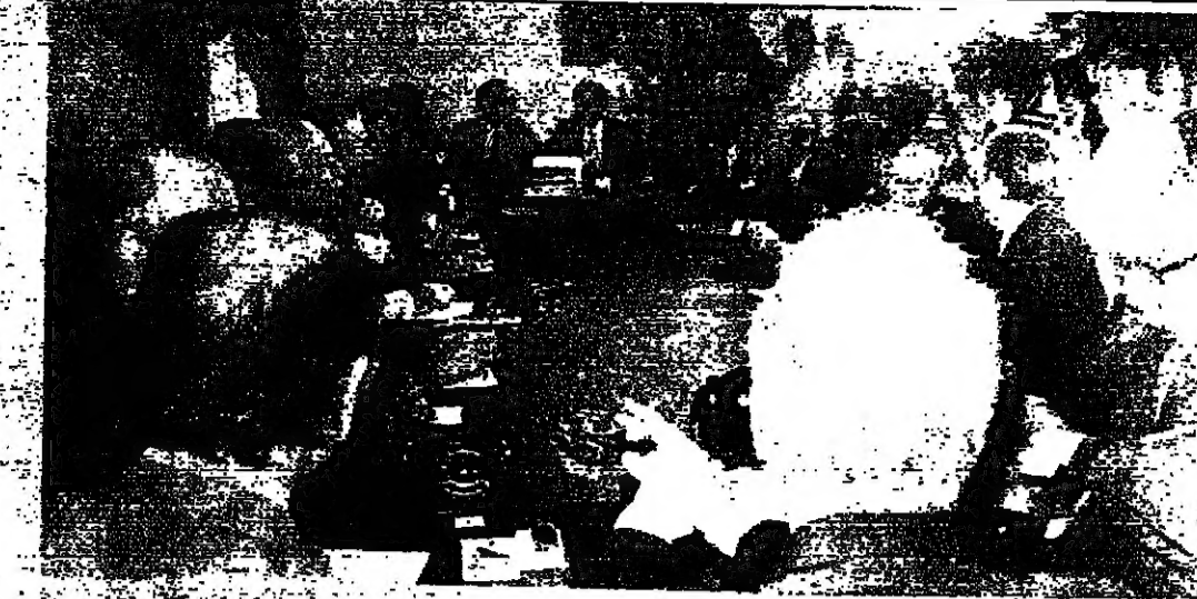
هيئة الحوار اجتماعها في السراي أمس